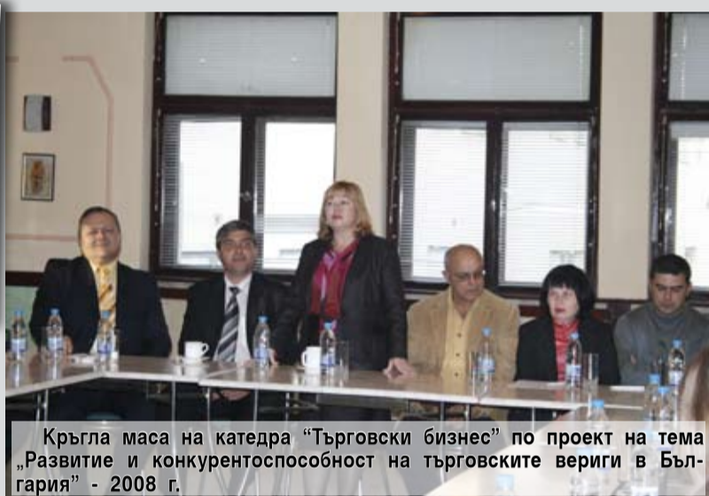
Кръгла маса на катедра “Търговски бизнес” по проект на тема „Развитие и конкурентоспособност на търговските вериги в България” - 2008 г.