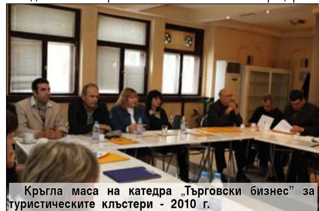
Кръгла маса на катедра „Търговски бизнес” за туристическите клъстери - 2010 г.

Необходимостта от подготовката на кадри с бакалавърска икономическа квалификация по туризъм е породена от все по-нарастващата роля на отрасъла в икономиката на страната ни. В същото време един от проблемите на туризма в България е липсата на достатъчно и добре подготвени кадри. В този смисъл, с откриването на специалността, катедра „Търговски бизнес” ще даде своя принос в подготовката и развитието на висококвалифицирани