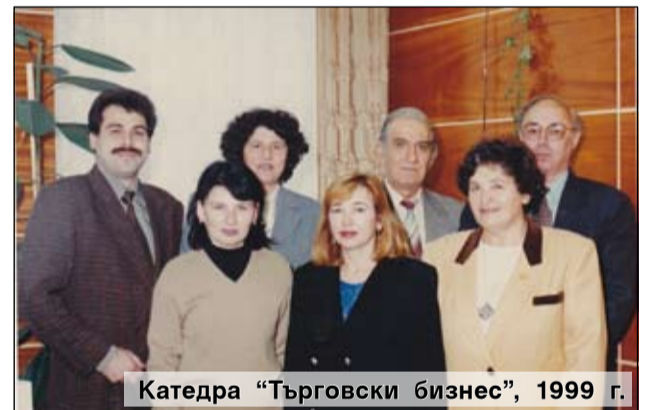
Катедра „Търговски бизнес“, 1999 г.