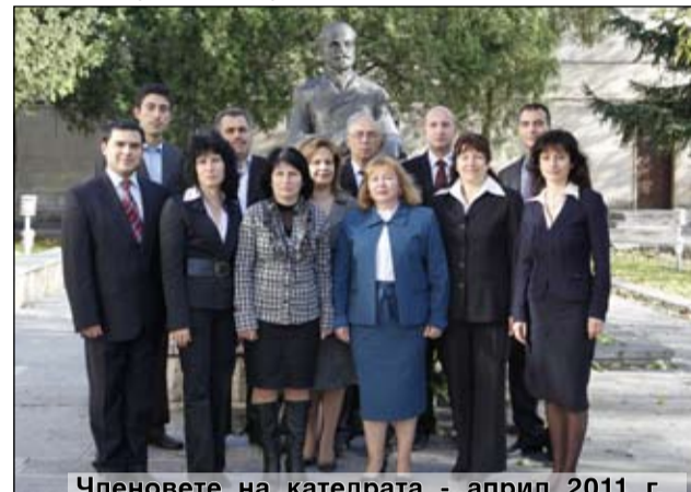
Членовете на катедрата - април 2011 г.

В приетите през 2008 г. учебни планове за ОК „Бакалавър“ катедра „Търговски бизнес“ участва с 11 задължителни и 4 избираеми дисциплини в обучението на почти всички специалности