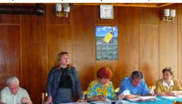
Междууниверситетски семинар - с. Орешак, 2008 г.