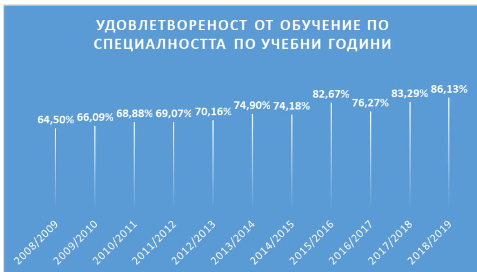
Фиг. 1. Равнище на удовлетвореност на студентите от обучение по специалността

увеличение е с над 20%. Това е атестат за непрекъснато повишаване на качество на обучение в Стопанска академия.