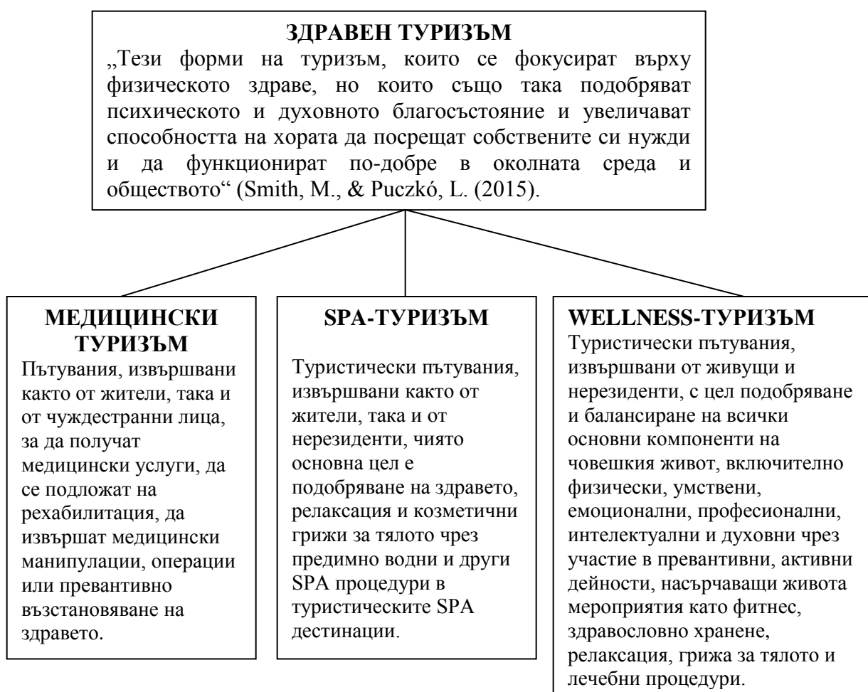
Фиг. 1.2 Дефиниции на компонентите на здравния туризъм (съставен от автора)

Някои организации, по-специално Global Wellness Institute, включват SPA туризма в Wellness-туризма (GWI, 2017), а авторите на изследването Research for TRAN Committee -Health tourism in the EU: a general investigation (Mainil et al. (2017) разглеждат SPA-туризма като отделен вид здравен туризъм, съчетаващ медицински и немедицински елементи, и по този начин се намира между медицинския туризъм и Wellness туризъм. Въз основа на извършеното изследване авторът предлага следната схема, която разкрива същността и съотношението на компонентите на здравния туризъм.