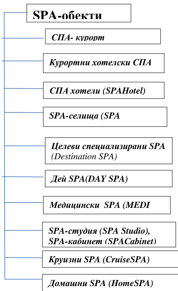
Фиг. 1.1 Класификация на SPA-обектите в Латвия.

Днес концепцията за SPA се е разширила до концепцията за модерен курорт и комплекс от услуги, в които всичко е насочено към постигане на релаксация и здравословно отношение към организма. SPA днес обозначава цяла индустрия за красота и здраве.